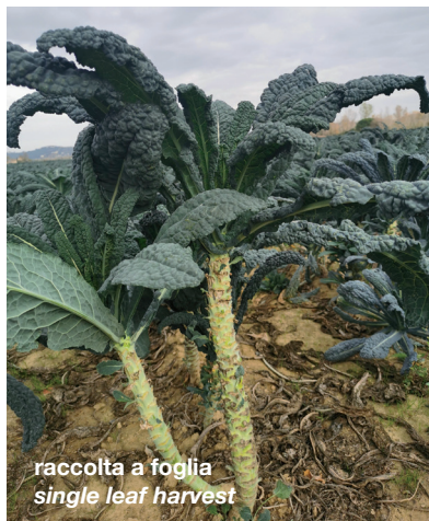
raccolta a foglia single leaf harvest

Pianta | Plant compatta, molto uniforme compact, very uniform